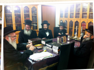
בית הוראה "צדק ומשפט"