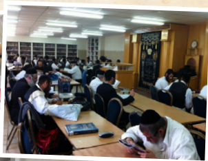
כולל אברכים "אור המאיר"