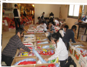
חלוקת קמחא דפסחא ועזרה לנוקמים