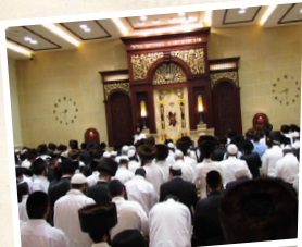
בית הכנסת הגדול "היכל הקודש"