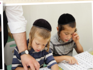
מוסדות חינוך לבנים