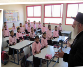
מוסדות חינוך לבנות