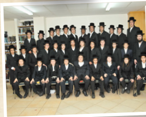
ישיבה לבחורים "תפארת מוהרא"ש"