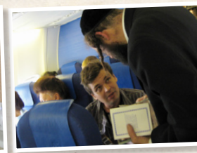
הפצת ספרי רבנו ז"ל