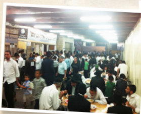
בית התבשיל "אהל אברהם"