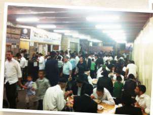
בית התבשיל "אהל אברהם"