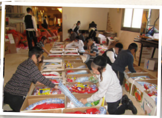
חלוקת קמחא דפסחא ועזרה לזקקים