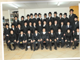
ישיבה לבחורים "תפארת מוהרא"ש"