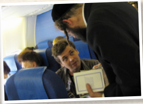
הפצת ספרי רבנו ז"ל