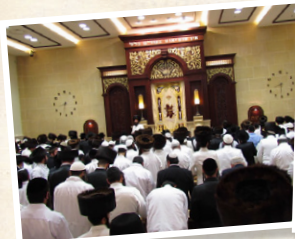
בית הכנסת הגדול "היכל הקודש"