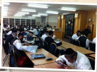
כולל אברכים "אור המאיר"