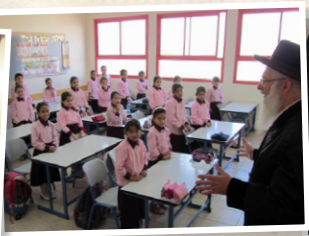
מוסדות חינוך לבנות