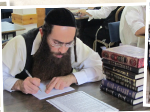
כולל הוראה "תפארת בנימין"