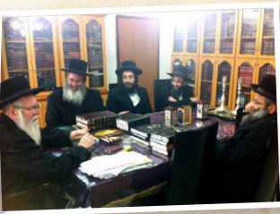
בית הוראה "צדק ומשפט"