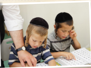
מוסדות חינוך לבנים