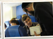
הפצת ספרי רבנו ז"ל