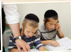
מוסדות חינוך לבנים