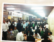
בית התבשיל "אהל אברהם"