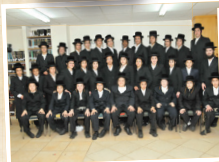
ישיבה לבחורים "תפארת מוהרא"ש"