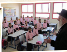
מוסדות חינוך לבנות