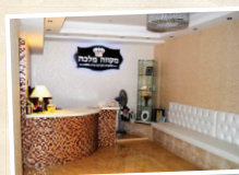
מקוה מלכה המסוגל לפקידת עקרות