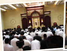
בית הכנסת הגדול "היכל הקודש"