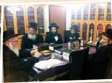
בית הוראה "צדק ומשפט"