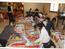
חלוקת קמחא דפסחא ועזרה לנוקמים