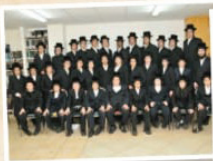
שיבה לבחורים "תפארת מוהראש"