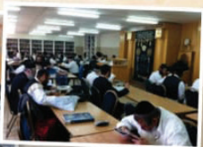
כולל אברכים "אור המאיר"