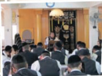
כולל הוראה "תפארת בנימין"