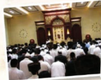
חלוקת קמחא דספסא ועזרה לנטקיים בית הכנסת הגדול "היכל הקודש"