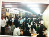
בית התבשיל "אהל אברהם"